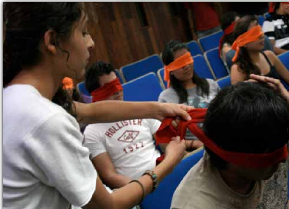
OJOS TAPADOS

fue el encargado de esta actividad, la organización era excelente, mientras en el auditorio se llevó a cabo el informe; en uno de los baños para caballeros, algunos alumnos llenaron dos toneles de plástico, de 200 litros, con globos llenos de agua, que serían utilizados en la tradicional guerra al finalizar el rally.